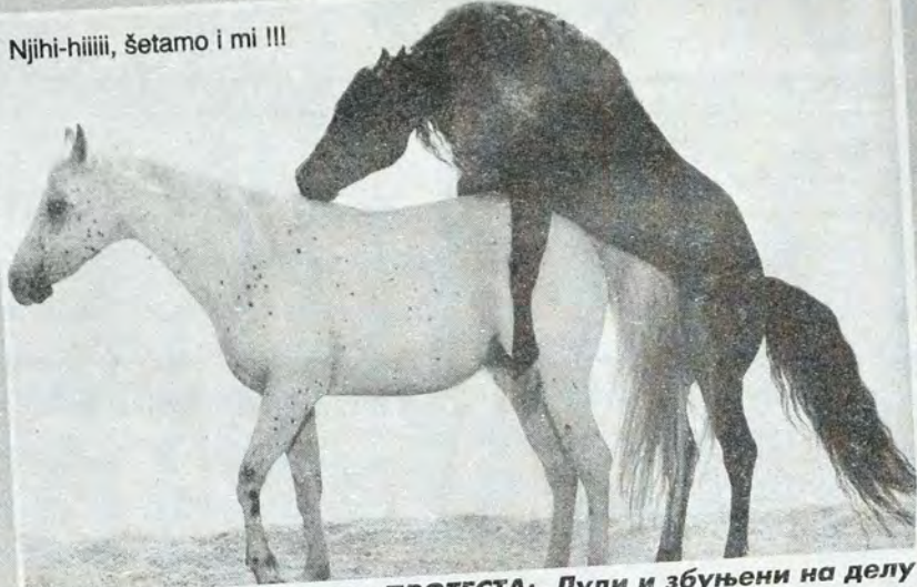
Сцена после завршетка ПРОТЕСТА: Луди и збуњени на делу