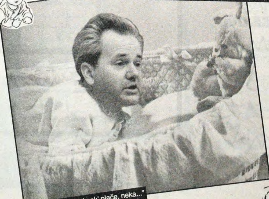
"I plače mali zeka, i nek' plače, neka..."