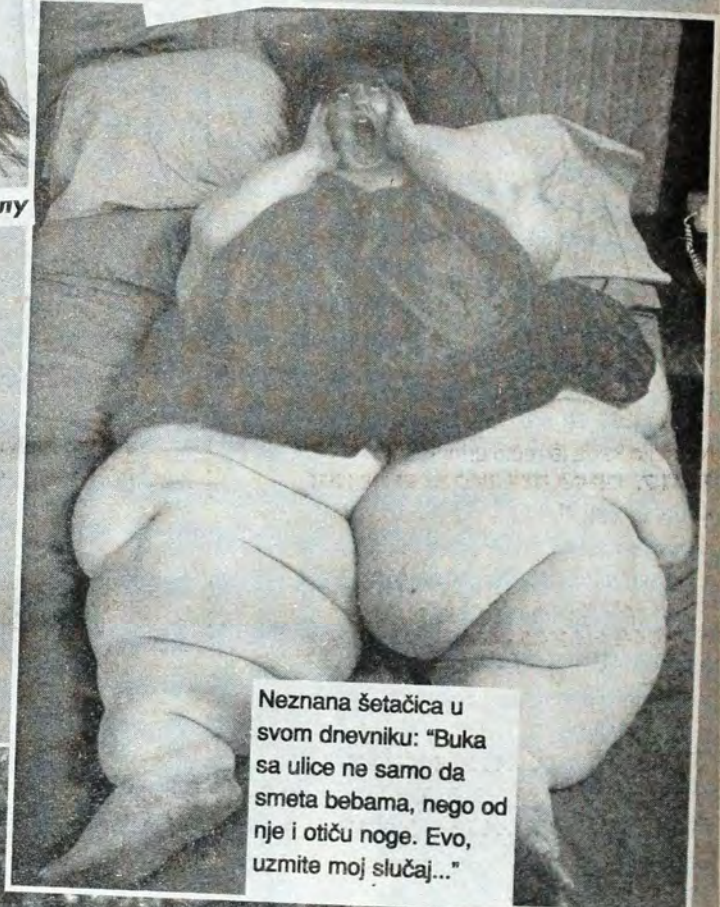
Незнана šetačica у свом дневнику: "Бука са улице не само да смета бебама, него од ње и отићу ноге. Ево, узмите мој случај..."