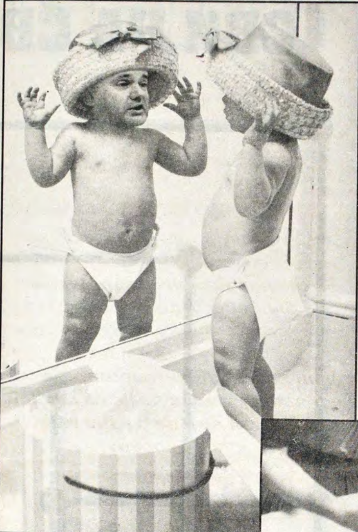
Radi pravilnog razvoja detetove psihe, Slobebu nije poželjno puštati da se gleda u ogledalu (to može da izazove fras koji će ostaviti trajne posledice na vašeg malog Čedicu).