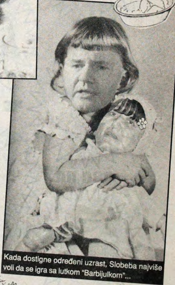
Kada dostigne određeni uzrast, Slobeba najviše voli da se igra sa lutkom "Barbijulkom"...