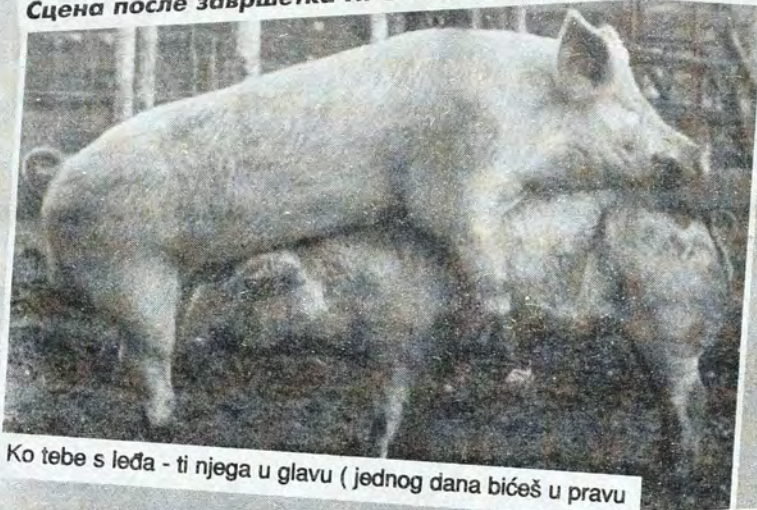
Ko tebe s leđa - ti njega u glavu (jednog dana bićeš u pravu)