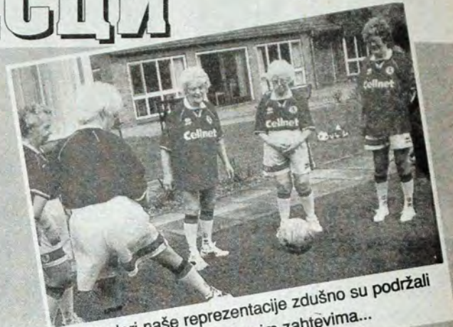
Фудбалери наше репрезентације здушно су подржали студенте у њиховим захтевима...