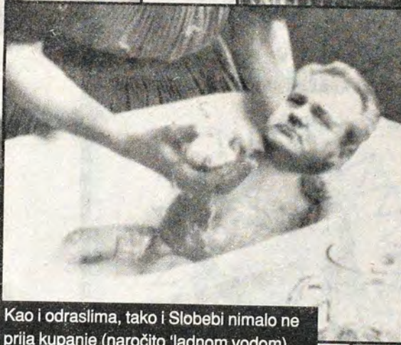
Kao i odraslima, tako i Slobebi nimalo ne prija kupanje (naročito 'ladnom vodom)...