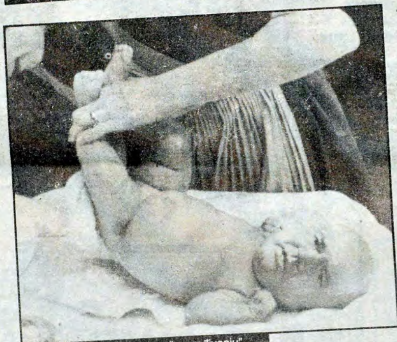
Budući da se radi o lokalnom "uneredivanju", previjanč je najbolje prepustiti dadilji Gonzales...