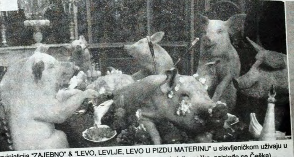
Канibalizam у прaksi: припадници свинjалициjа "ЗАЈЕБНО" & "ЛЕВО, ЛЕВЛЈЕ, ЛЕВО У ПИЗДУ МАТЕРИНУ" у славjеничком уживају у заједничкој већери. Студенткиња не учествује у истој, она се само смеђка (ко се последњи смеђка, најслађе се Чешка)...