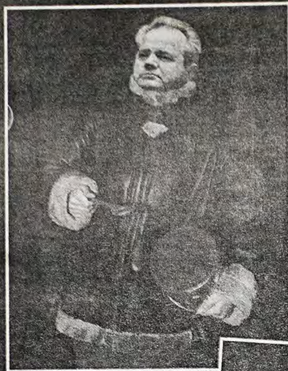
SLOBODAN MILOŠEVIĆ: Volim i ja Vas. Da lupam.