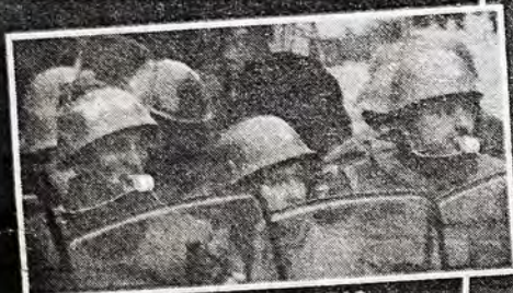
HORDON ZOTJININ GOLATJA: "Ne klepetaji nanulama, već šerpama i cokulama."

Isprovocirani izveštavanjem u udarnoj informativnoj emisiji na RTS-u (19.30 po srednje evropskom vremenu) i pojavom na ulicama neidentifikovanih lica u plavim uniformama koji neodoljivo podsećaju na lekeće policajce, žitelji Dedinja & njihove komšije pridružili su se protestu "Zvizduk u pola osam". Dakle, i Dedinje je prolupalo.