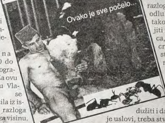
Ovako је sve počelo...

СЕНЗАЦИОНАЛНО ОТКРИЋЕ ЛОНДОНСКОГ ЛИСТА THE GUARDIAN СРБИ ЛУДИЛОМ ЗАРАЗИЛИ, ДОТАДА МИРНЕ И ДОСТОЈАНСТВЕНЕ, ЕНГЛЕСКЕ КРАВЕ. НОВЕ САНКЦИЈЕ ЗА СРБИЈУ? ФОТОГРАФИЈА: АУТЕНТИЧНИ ДОКУМЕНТИ ИЛИ НОВА ПРЕВАРА! ИРЦИ ВРТЕ ГЛАВОМ, ШКОТИ СВИРАЈУ ГАЈДЕ, ЈАВНОСТ УЗНЕМИРЕНА.