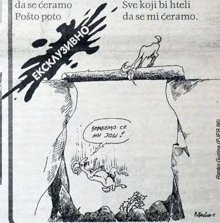
Ranko Guzina (PJER 96)

Da ćeramo te i te Bez te bez ove A mi im poručujemo Sa ovoga mjesta E nećemo da se ćeramo I poslednji put pozivamo Ćeromane svih zemalja Da se ujediniamo I ćeraće išćeramo I u zemlju ućeramo I šćeramo u mišje rupe I odućimo od ćeranja Sve koji bi hteli da se mi ćeramo.