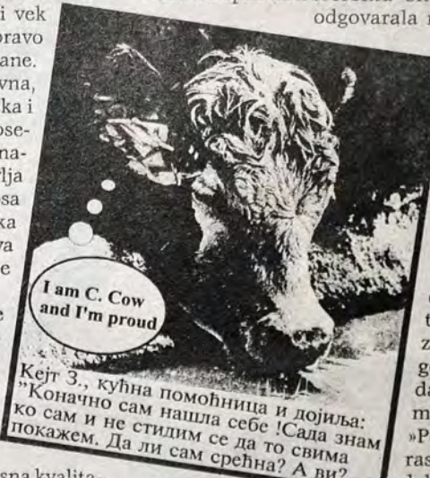
I am C. Cow and I'm proud

Uz sve ovo formirana је и posebna radna grupa која треба да ispita да li bi Srbini - biraču за sledeći vek odgovarala neka anatomska